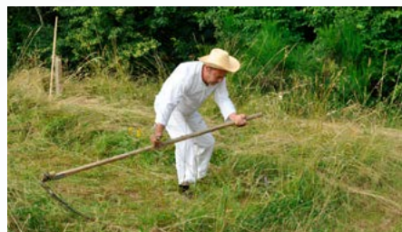
IV Janowickie Sianokosy