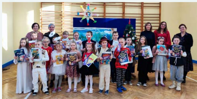
Uczestnicy konkursu recytatorskiego