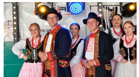
Święto Gminy Bestwina – Laski uOzgraj