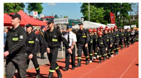
Wojewódzkie Zawody Sportowo – Pożarnicze