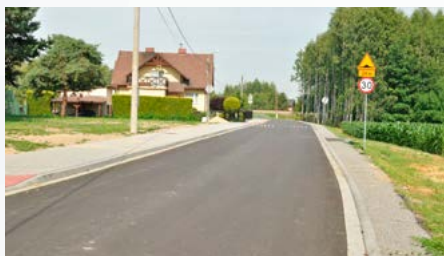
Ul. Sportowa – obok boiska KS Bestwinka