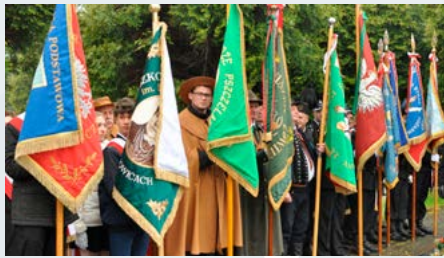
3 maja – uroczystości w Kaniowie