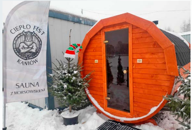
Sauna na terenie ORIWS

Chętni do skorzystania mogą odwiedzić profil sauny w mediach społecznościowych lub zadzwonić pod numer 533 609 339.