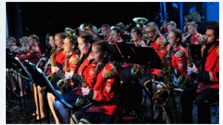
25 lat gminnej Orkiestry Dętej