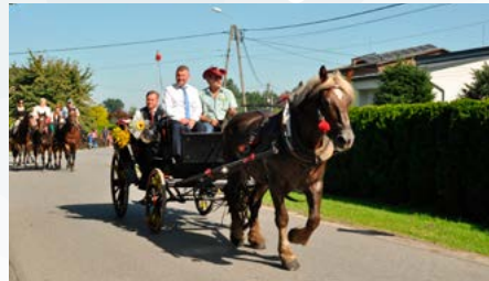
Dożynki Gminne w Bestwinie