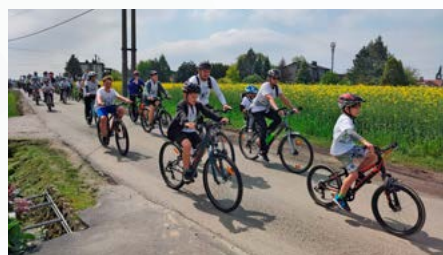
XVI Janowicki Rajd Rowerowy