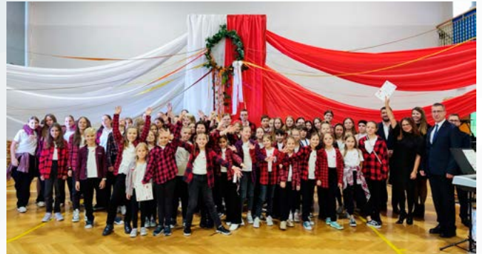
Chór „Cantata” – zdobywcy Grand Prix

Przedszkola – solo, duet, zespół do 6 osób: Sześcioutki ; Bestwina