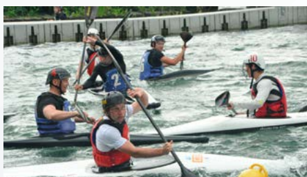
Turniej kajak-polo w Kaniowie