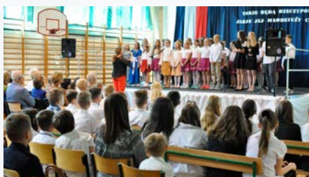
30 lat Szkoły Podstawowej w Bestwinie