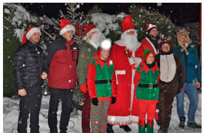
Święty Mikołaj i jego ekipa

Jedni pielgrzymują do włoskiego Bari, gdzie znajdują się relikwie św. Mikołaja z Miry. Inni udają się do fińskiego Rovaniemi, a niektórzy wypatrują sań i reniferów wysoko na niebie. Tymczasem dla dobrego biskupa nie mają ograniczeń ani czas ani przestrzeń. W dniu 6