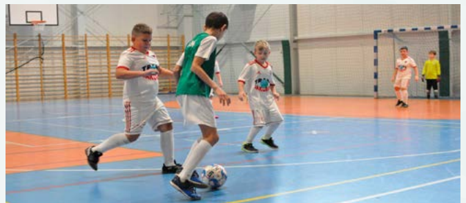
Rozgrywki w hali sportowej w Kaniowie

Kluby otrzymały puchary i piłki, natomiast zawodnicy – statuetki i vouchery ufundowane przez Centrum Fizjoterapii Active Heal. Dziękujemy wszystkim za piękną grę i zaangażowanie w organizację memoriału.