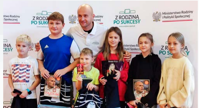
Z uczniami – zwycięzcami konkursów