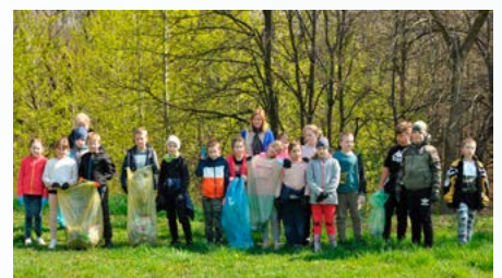
Wiosenne sprzątanie Ziemi