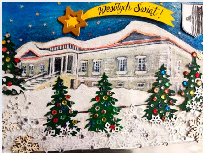
Karolina Capek – zwycięski projekt