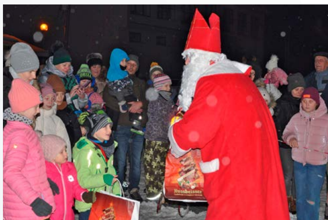
Nikt nie odszedł z pustymi rękami

Jedni pielgrzymują do włoskiego Bari, gdzie znajdują się relikwie św. Mikołaja z Miry. Inni udają się do fińskiego Rovaniemi, a niektórzy wypatrują sań i reniferów wysoko na niebie. Tymczasem dla dobrego biskupa nie mają ograniczeń ani czas ani przestrzeń. W dniu 6