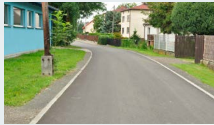
ul. Mirowska w Kaniowie