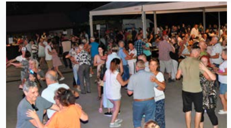
XXI Święto Karpia Polskiego