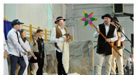
Przedstawienie jasełkowe w Kaniowie