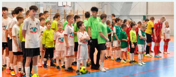
Drużyny biorące udział w turnieju