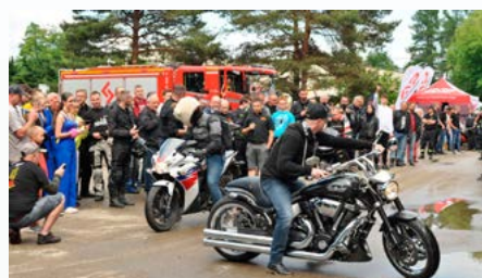
Charytatywny Piknik Motocyklowy