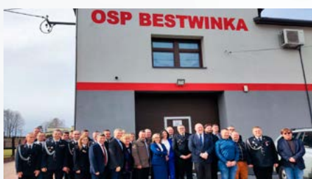
Termomodernizacja OSP Bestwinka