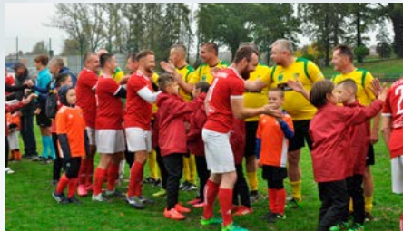
Memoriał Ryszarda Krausa w Bestwinie